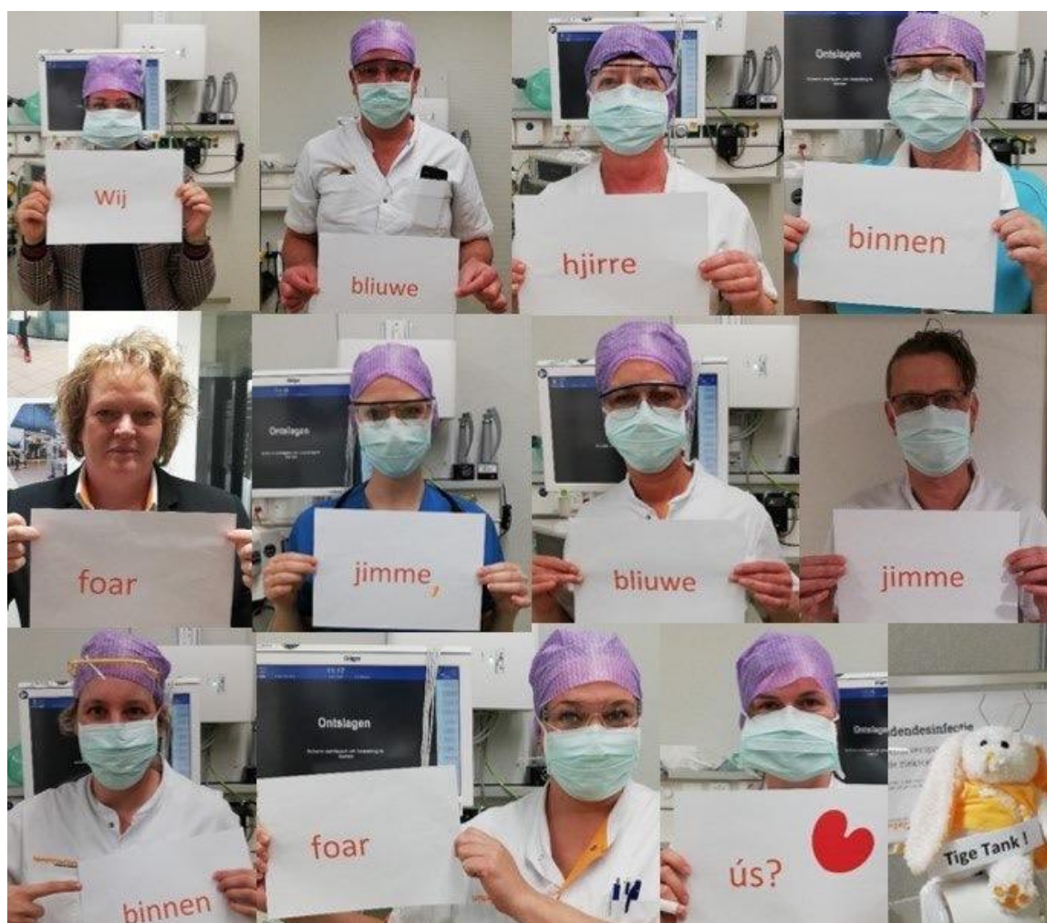
Aldus personeel van De Tjongerschans